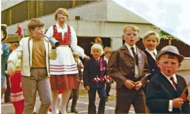
Første 17.mai tog på Justvik (1972) runder skolebygningen.