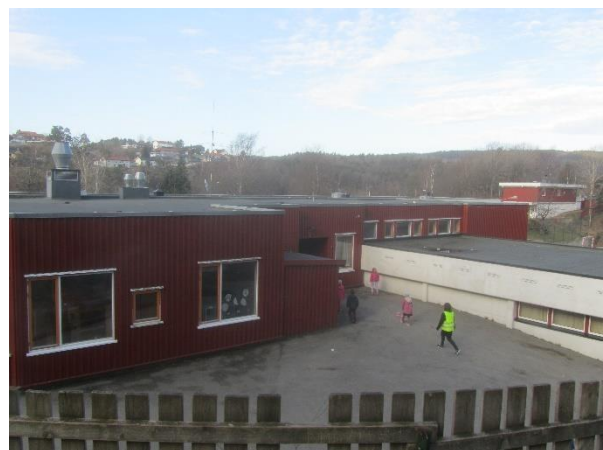
Tilbygget med lærernes arbeidsrom og tilbygget med SFO (1998)

Siste utbygging på Justvik skole skjedde i 1998.