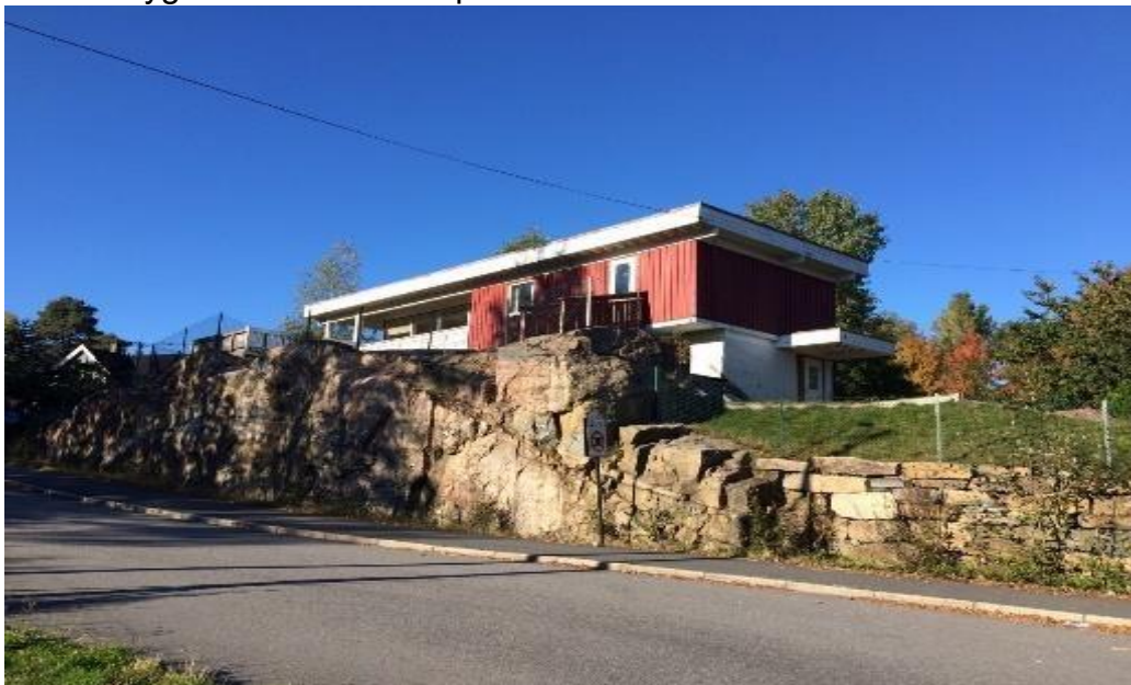
«Rektorboligen» slik den lå like ved skolen.

Ved Justvik skole ble dert bygd en rektorbolig. Dette er sannsynligvis en av de siste som er bygd for dette formål på våre kanter.