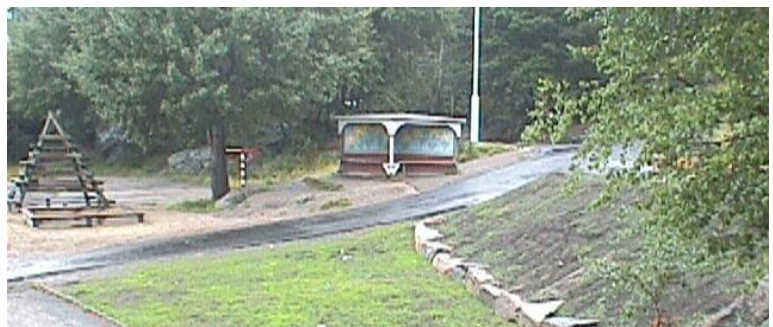
Fuglefjellet og pratebua