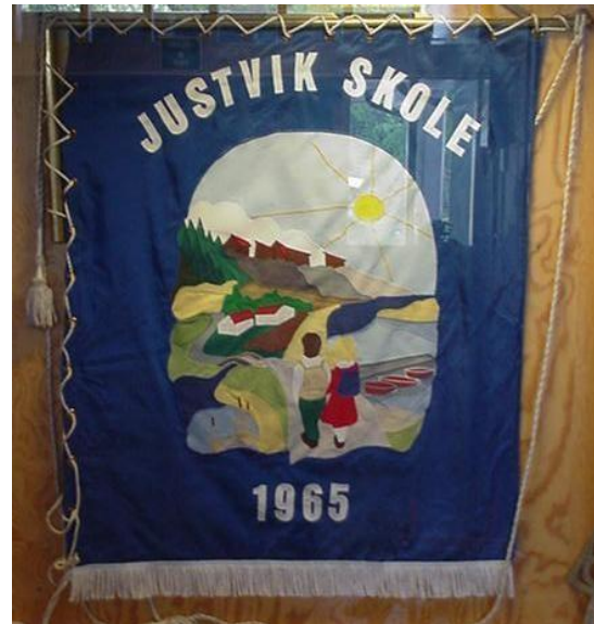
Skolens fane laget 1987

17.mai 1987 var fanen klar til bruk for første gang.