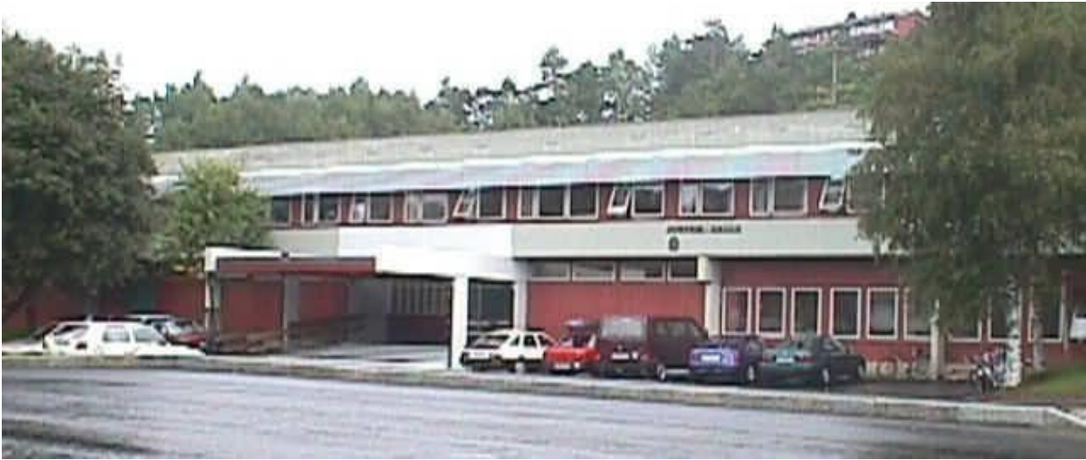
Første byggetrinn på Justviks andre skolebygning (1965-2018)

Skoleårene 1963/64 og 1964/65 hadde elever i 4.klasse fra Justvik håndarbeid/sløyd på Ve skole, og 5.-7.klasse gikk hele året på Ve skole. 1.klasse gikk på Justvik gamle skole og 2.-3.klasse gikk på Ålefjær skole.