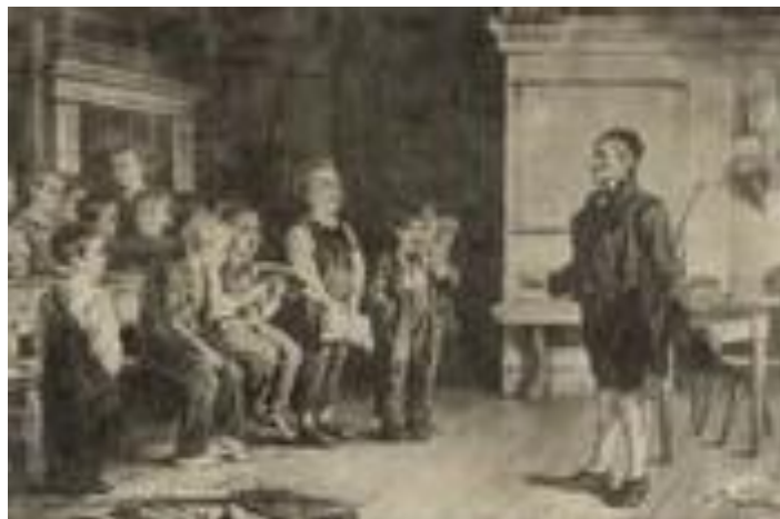
Fra boka «Omgangsskolelæreren i allmueskolen» (2021) av Gry Heggli.

I over 100 år fra loven ble innført, måtte barna få undervisning på omgangsskolen. Den var i stua på en gård i bygda, og der kom læreren og hadde skole i noen uker. Så dro han videre til andre gårder og holdt skole der. Kanskje rakk han to eller tre slike omganger i løpet av et år. Til sammen skulle skoletiden for elevene være 9 uker i året til sammen, men noen steder der det var få barn, ble det mindre.