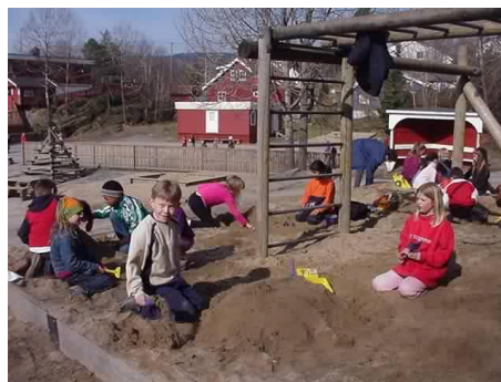
Sand og klatring

En av de mest populære sangene som elevene fremførte under dugnadene var «La det svinge, la det rock'n roll.» Det var Bobby Socks bidrag i Grand Prix, som de vant med i 1985.