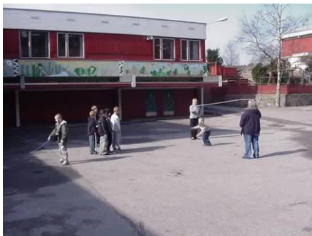
Skolegården med elevkunst på veggen.

Trivsel i skolegården var resultatet med sittetårn, ronser i 5-kant, sitteplasser under tak og etter hvert «taubane». Også en hinderløype ble det plass til. Prosjektet sto ferdig i 1985/86.