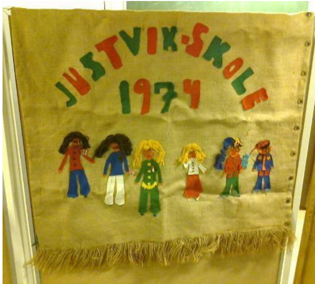
Skolens første fane – laget i 1974